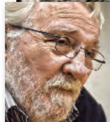
Narra la historia del paro de la UOM del '75