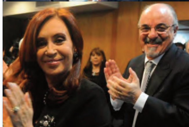
Reunión del Consejo del Salario